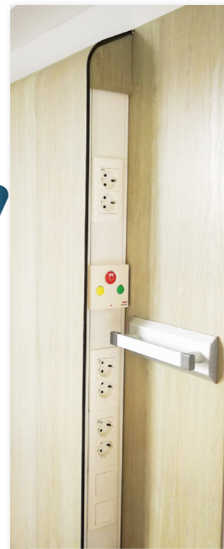
FLORENCE 100 INFÄLLD I MÖBEL

Den färdiga produkten blir en unik leverans och följs av ett certifikat med sitt unika nummer. Maxeta har levererat försörjningspaneler till bland annat: Nya Karolinska Solna, Angereds Närsjukhus, Varbergs sjukhus, Luleå Universitetssjukhus och Karolinska Huddinge.