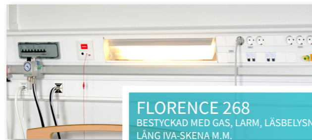
FLORENCE 268 BESTYCKAD MED GAS, LARM, LÄSBELYSNING, LÅNG IVA-SKENA M.M.