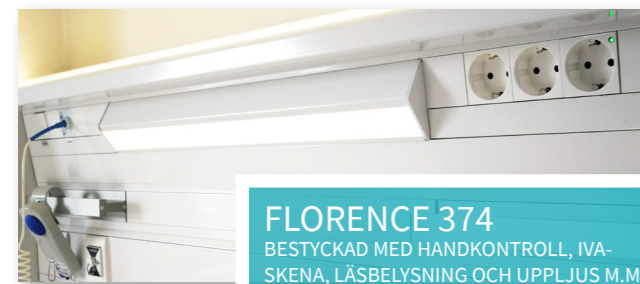
FLORENCE 374 BESTYCKAD MED HANDKONTROLL, IVA-SKENA, LÄSBELYSNING OCH UPPLJUS M.M.