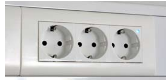
Eluttag med LED-indikator.

Vår minsta profil, 100x65 mm. Profilen har raka sidor och passar perfekt monterad direkt på vägg, men också monterat i möbel. Kan monteras vertikalt eller horisontellt. Profilen finnes också för infällnad i vägg. En enkel och effektiv lösning när man inte har behov för integrerad belysning. Bestyckas enligt önskemål Standardfärg vit RAL 9003.